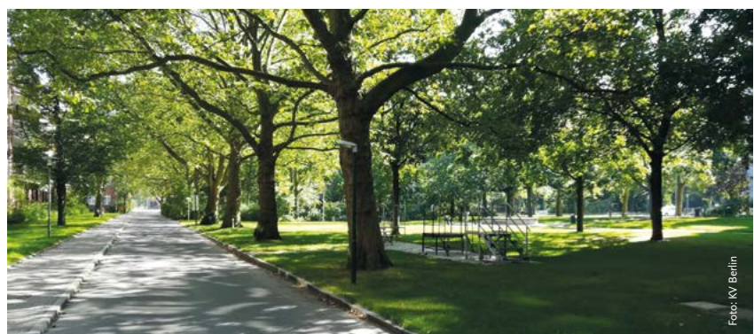
Idyllisch gelegen auf dem Campus des Gesundheits- und Sozialzentrums Moabit: die Gewaltschutzambulanz.